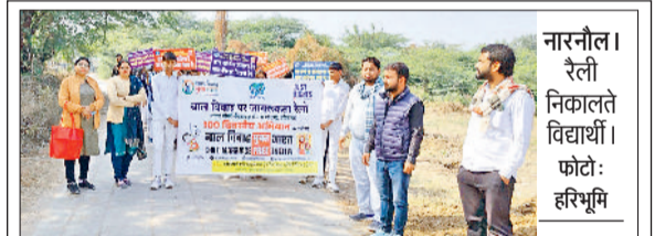
नारनौल। रैली निकालते विद्यार्थी।