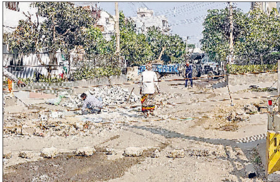
रेवाड़ी। इंटरलाकिंग टाइल्स से भरे जा रहे सेक्टर-4 की सड़क के गड्डे व सेक्टर-4 के जिमखाना रोड पर हुए गड्डे।

नगर परिषद की ओर से एक साल के अंतराल में करोड़ों रुपये की लागत से बनाई गई सड़कें धराशाही हो चुकी हैं। सेक्टर-3 व सेक्टर-4 में बनी तारकोल की सड़कों की लंबे समय से रोड़िया बिखर रही है। सेक्टरों की सड़कों पर जगह-जगह गड्डे हो चुके हैं। सेक्टरों की इन सड़कों पर कई बार पैचवर्क भी किया जा चुका है। तारकोल की सड़कों पर सीमेंट से पैचवर्क किया जा चुका है, लेकिन गुणवत्ता की कमी से पैचवर्क भी नहीं टिक पा रहा है। अब इन सड़कों के गड्डों को इंटरलाकिंग टाइल्स से भरकर खानापूर्ति की जा रही है। सोमवार को सेक्टर-4 के मांडल टाउन थाना रोड पर हुए गड्डों को इंटरलाकिंग टाइल्स से भरने का काम किया गया। विजिलेंस टीम ले चुकी कई सड़कों के संपल पिछले दिनों विजिलेंस की टीम ने मांडल