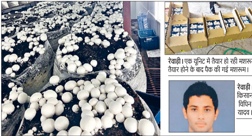
रेवाड़ी। एक यूनिट में तैयार हो रही मशरूम तैयार होने के बाद पैक की गई मशरूम।

यूनिट स्थापित करने वाले किसान मशरूम की खेती से एक बार में तीन से चार लाख रुपये कमा रहे