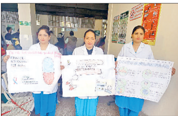
रेवाड़ी। कार्यक्रम में पेंटिंग से जागरूक करती स्वास्थ्यकर्मी।