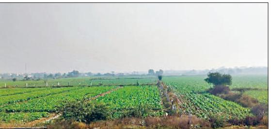
रेवाड़ी। नारनौल रोड स्थित खेतों में सरसों की फसल।

सुबह से ही आसमान में साफ रहा। धुआं वातावरण में कोहरे की तरह छाया रहा। अधिकतम तापमान 0.5 डिग्री सेल्सियस की कमी के साथ 26.0 डिग्री पर आ गया। न्यूनतम तापमान 0.4 डिग्री सेल्सियस की कमी के साथ 7.2 डिग्री सेल्सियस दर्ज किया गया। हवा में नमी का स्तर 45 प्रतिशत तक रहा, जबकि हवाओं की गति काफी मंद रही। इस साल तापमान सामान्य से काफी कम चल रहा है। गत वर्ष 24 नवंबर को अधिकतम तापमान 30.0 डिग्री और न्यूनतम 13.5 डिग्री सेल्सियस दर्ज किया गया