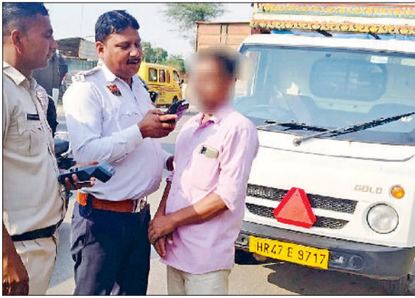
रेवाड़ी। वाहन चालक की शराब मात्रा की जांच करती पुलिस।