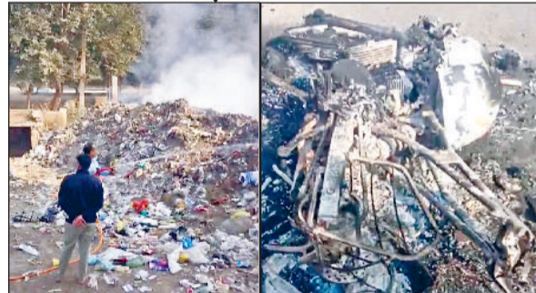
ब्रास मार्केट में लगी आग बुझाते हुए दमकलकर्मी, आग से जलकर राख हुई बाइक।

ब्रास मार्केट में सोमवार दोपहर कूड़े के ढेर में लगी आग से हड़कंप मच गया। फायर ब्रिगेड ने मौके पर जाकर आग पर काबू पाया। वहीं जौनावास में चलती बाइक में आग लग गई, जिससे बाइक जलकर राख हो गई। ब्रास मार्केट के एक कोने में भारी मात्रा में कूड़ा डाला जाता है। पार्क के पास कूड़े के ढेर लगे हुए हैं, जो मार्केट के लिए बदनूमा दाग की तरह साबित हो रहे हैं। सोमवार को दोपहर के समय कूड़े के ढेर में आ लगी आग। इससे आसपास के दुकानदारों में आग फैलने की आशंका से हड़कंप मच गया। सूचना मिलने के बाद फायर ब्रिगेड को गाड़ी मौके पर पहुंच गई। मॉडल टाउन थाना पुलिस भी सूचना मिलते ही मौके पर पहुंच गई। काफी देर बाद फायर ब्रिगेड ने आग