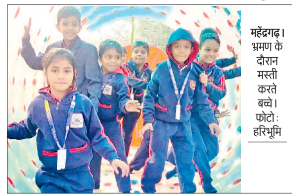
हरिभूमि न्यूज महेंद्रगढ़।