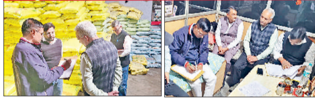
रेवाड़ी। दुकान पर यूरिया का स्टॉक चेक करती टीम, दुकान पर यूरिया का स्टॉक रजिस्टर चेक करती टीम।

मिला। निरीक्षण में दुकान का लाईसेंस वैध पाया गया। दुकान पर पीओएस मशीन यूरिया के 1470 बैग स्टॉक में थे, जबकि निरीक्षण के दौरान 1370 बैग यूरिया मिला। फर्म की ओर से खाद का स्टॉक रजिस्टर अपडेट नहीं किया गया व