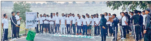
रेवाड़ी। मैराथन को रवाना करते हुए कंपनी अधिकारी।

बावल स्थित सनोह इंडिया ऑटोमोटिव कंपनी के कर्मचारियों के स्वास्थ्य और टीम भावना को बढ़ावा देने के उद्देश्य से सोमवार को मैराथन का आयोजन किया। मैराथन का आयोजन आईएमटी बावल में किया गया, जिसका थीम रन फॉर हेल्थ था। मैराथन की दूरी 5 किलोमीटर थी, जिसे दो वर्गों में विभाजित किया गया। पहले वर्ग में 36 वर्ष तक की आयु के प्रतिभागी व दूसरा वर्ग में 36 वर्ष से अधिक आयु के प्रतिभागियों सहित 70 कर्मचारियों ने भाग लिया। प्रतिभागियों को प्रोत्साहित करने के लिए