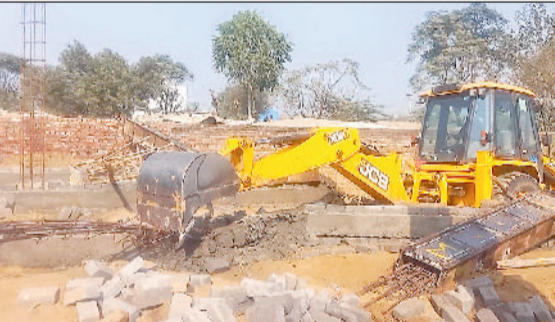
रेवाड़ी। अवैध कॉलोनी का निर्माण तोड़ती जेसीबी।

डीटीपी विभाग की टीम ने सोमवार रेवाड़ी-गढ़ी बोलनी रोड की राजस्व सीमा में अवैध रूप से विकसित की जा अवैध कॉलोनी व अवैध निर्माणों पर तोड़फोड़ की कार्रवाई की। डीटीपी की कार्रवाई से प्लांटिंग करने वाले लोगों में खलबली मच गई। पुलिसबल की मौजूदगी में डीटीपी की कार्रवाई का कहीं विरोध नहीं हुआ। डीटीपी की लगातार कार्रवाई के बाद भी कॉलोनाइजर व डीलर नई कॉलोनीयां विकसित करने में लगे हुए हैं। डीटीपी के निर्देश पर सोमवार को पुलिसबल व ड्यूटी मजिस्ट्रेट के साथ टीम गढ़ी बोलनी रोड स्थित गांव लालपुर में पहुंची, जहां डीटीपी की टीम ने बिना अनुमति के विकसित की जा रही अवैध कॉलोनी सहित 7 अवैध निर्माणों को जमींदोज कर दिया।