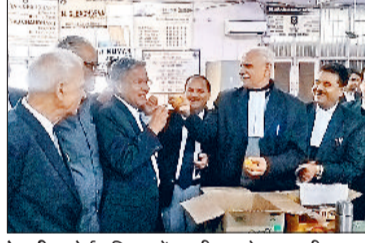
रेवाड़ी। कोर्ट परिसर में खुशी मनाते हुए वकील।